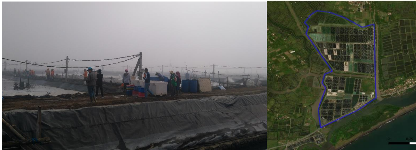
Gambar 1. Lokasi tambak PT Delta Guna Sukses

PT Mega Marine Pride (PT MMP) merupakan salah satu perusahaan processing udang yang ada di wilayah Jawa Timur. Perusahaan ini mendaftarkan PT Delta Guna Sukses (PT DGS) sebagai supply chain mereka. PT Delta Guna Sukses (PT DGS) merupakan salah satu perusahaan yang melakukan kegiatan budidaya udang dari jenis Litopenaeus vannamei atau lebih dikenal dengan sebutan udang Vaname. PT DGS berada di wilayah selatan Kabupaten Jember, tepatnya di Desa Mayangan, Kecamatan Gumukmas. Perusahaan ini telah melakukan kegiatan operasional budidaya-nya dari tahun 1987 berproduksi pertama kali tahun 1988 (Blok A), awalnya dengan membudidayakan udang windu ( Penaeus monodon ) secara semi-intensive. Sejak tahun 2000, secara bertahap, PT DGS membudidayakan udang jenis Litopenaeus vannamei secara intensif dengan padat tebar antara 125 – 180 ekor/m 3 . Benur yang dibudidayakan adalah dari hatchery yang berasal dari PT Prima Larva Bali. Produksi yang dihasilkan pada tahun 2022 yaitu sebanyak 1.098,43 ton.